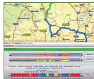
Revisualisation de trajet On peut revoir le trajet d'un véhicule à tout moment grâce au dynamisme du mode magnétoscope.