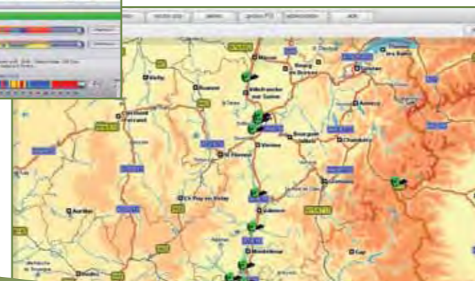
Mode plein écran Visualisation claire et précise de l'ensemble de votre flotte d'un seul coup d'œil. Trageo déroule le film de l'activité en temps réel, en continu et en simultané.